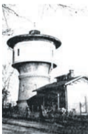
Wieża ciśnień - zdjęcie z około 1930 roku

chlarszową oraz budynki położone pomiędzy dworcem a parowozownią.