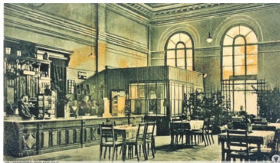
Widok na wnętrze restauracji dworcowej - rok 1930

Na zdjęciu z początku XX wieku można podziwiać wnętrza kawiarni dworcowej. Stacja miała duże znaczenie nie tylko towarowe, ale i pasażerskie. Krzyżowały się tutaj trzy linie kolejowe, w tym dwie o wiodącym znaczeniu. Kilkanaście lat temu zniknęły wieża ciśnieniowa i pompownia, nieużytkowana od 1998 roku. W 2015 roku żywota dokonała część infrastruktury stacji. Rozebrano parowozownię wa-