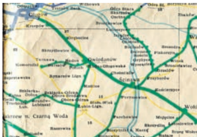
Mapa kolejowa - 1945 rok - mapa zeskanowana przez autora Neo[EN] i umieszczona na portalu fotopolska.eu

Wszystkie zdjęcia zamieszczone za zgodą portalu polska-org.pl