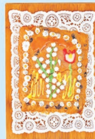
Wielkanocny mazurek to proste ciasto do upieczenia. Sztuka polega na oryginalnym ozdobieniu tego przysmaku.

Ciasto to ma tyłu samo zwolenników co przeciwników. I nie ma jednego właściwego przepisu. Ma być słodko i ozdobnie.