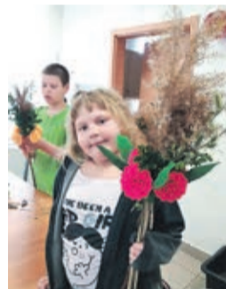
Palma wielkanocna wykonana podczas warsztatów w świetlicy CKGR w sołectwie Miłogoszcz.

Znawcy tematu przypominają, że pierwotnie miał on być nagrodą za długi 40 – dniowy okres wyrzeźbienia i skromnego jedzenia. Symbolicznie kończył Wielki Post. Gospodynie przykładały wagę do własnych oryginalnych przepisów. Rozpływająca się w ustach słodycz była podawana na wielkanocne śniadanie. Dzisiaj ciasto ma zazwyczaj kruchy spód posmarowany powidłami, kajmakiem czy nawet nutellą. Cała sztuka i wykwintność ciasta zawiera się w zdobieniu, bo mazurek ma nie tylko smakować, ale przede wszystkim wyglądać.