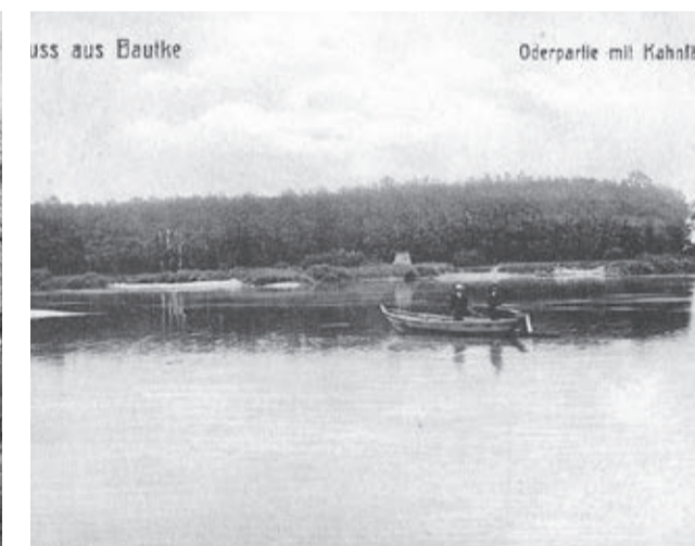
Przeprawa promowa Ciechłowice nie istnieje