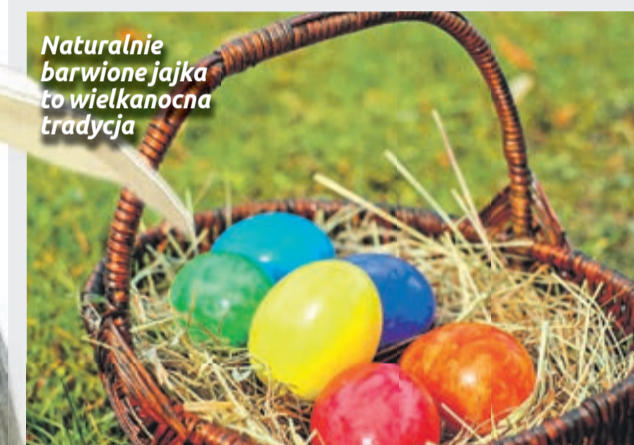
Naturalnie barwione jajka to wielkanocna tradycja