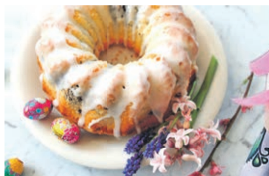
Wielkanocna baba drożdżowa to nr 1 wśród świątecznych ciast. Pełna bakalii, polana słodkim lukrem wygląda i smakuje wyśmienicie.

Wielkanocny zając to w naszym regionie zabawna ozdoba związana ze świątami. Wielkanocny zajączek, który przynosi prezenty, to zwyczaj, który zawędrował do Wielkopolski, Śląska i Pomorza z Niemiec. U naszego zachodniego sąsiada, zgodnie z tradycją, w nocy z Wielkiej Soboty na Wielką Niedzielę zajączek chodzi z koszyczkiem i zostawia ukryte w różnych miejscach drobne upominki. Przed świątami, dzieci wykonały podczas zajęć na świetlicach przepiękne zająca. Na zdjęciach można podziwiać zabawki wykonane w Chobieni. Gratulujemy!