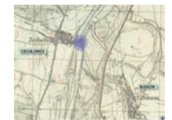
Przeprawa promowa Ciechłowice nie istnieje

wice (Zechelwitz) położone na lewym brzegu i Budków (Bautke, Eichdamm) znajdujący się w pewnej odległości od prawego brzegu. W Ciechłowicach przystań promowa znajdowała się niemal przy głównej drodze wsi, a w Budkowie do przystani prowadziła ścieżka. Obecnie przeprawa nie istnieje. Na starych pocztówkach można zobaczyć mieszkańców dawnych Ciechłowic. Dzisiaj warto zajrzeć do Ciechłowic by podziwiać wzniesione w XIX wieku kapliczki domkowe oraz majestatyczną Odrę.