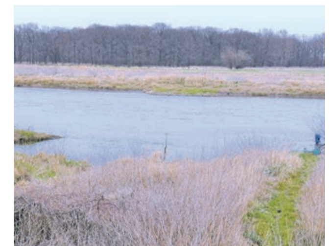
Obecny widok na Odrę w Ciechłowicach