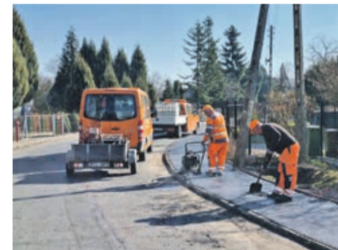
Tak wyglądają prace przy chodnikach.

Na inwestycję Gmina Rudna przeznaczyła ponad 532 000 zł.