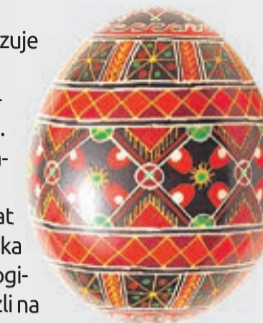
Pisanki ze wschodniej Ukrainy. Tradycyjnie malowane na czerwono. Symbolizują krew Chrystusa i Zmartwychwstanie

Jajko w tradycji chrześcijańskiej symbolizuje życie. Ale zwyczaj ozdabiania jajek sięga starożytności. Najstarsze pisanki pochodzą z terenów starożytnej Mezopotamii. Zwyczaj malowania jajek znany był w starożytnym Egipcie czy w czasach cesarstwa rzymskiego, czyli ponad 2 tysiące lat temu. Według mitologii germańskiej, jajka znosił zając, jako zwierzę poświęcone bogini Osterze. W Polsce archeolodzy znaleźli na opolskiej wyspie Ostrówek pisanki pochodzące z X wieku. W dawnych czasach wykonywane w Wielki Piątek pisanki dziewczęta wręczały chłopcom w Wielkanocny Poniedziałek, by uniknąć obłania wodą. Współcześnie jajka są zdobione na wiele sposobów.