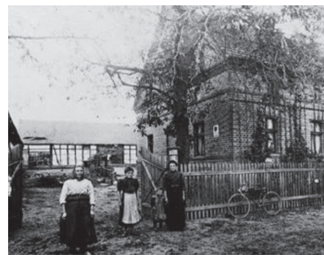
Jedno z gospodarstw w Ciechłowicach, ok. 1920 rok