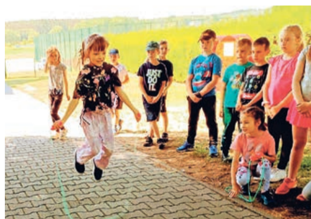
Uczniowie szkoły podstawowej w Chobieni świętowali Dzień Dziecka na sportowo. Były rywalizacje sportowe, zabawy integracyjne, turnieje piłki nożnej i siatkowej, moc konkursów lekkoatletycznych i kolejna odtańczona belgijka.