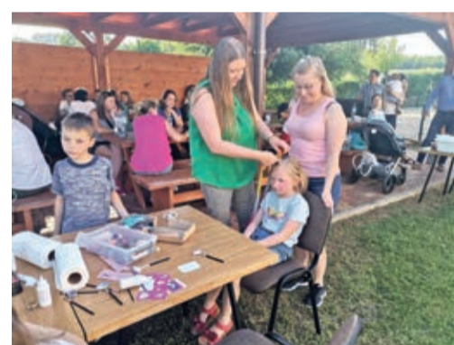
Toszowce - uśmiechnięte twarze dzieci wynagradzają wszystko.