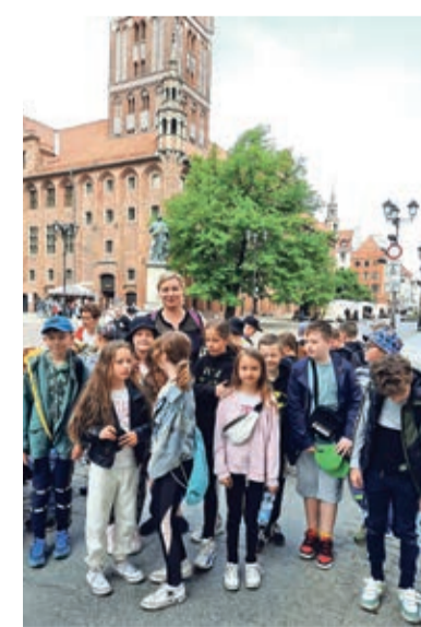
ki którym uczniowie mogą jeździć na wycieczki poznając historię, kul-

Ciesz się, że potrafimy korzystać z dostępnych programów, dzie-