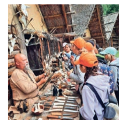
mitywnych łóżach wyścielanych sianem. Dotykali narzędzi, którymi posługiwali się przodkowie,

Po przybyciu na miejsce zwiedzanie zaczęliśmy od Nowego Miasta. Po spacerze urokliwymi uliczkami do Muzeum Toruńskiego Piernika, gdzie poznaliśmy techniki wypieku tych ciastek, wysłuchaliśmy przepięknych legend związanych z miastem i słynąciami na cały świat piernikami. Następnie własnoręcznie ulepiliśmy pierniki w różnych kształtach – tak relacjonują wycieczkę uczniowie z Rudnej, którzy wybrali się do Torunia.