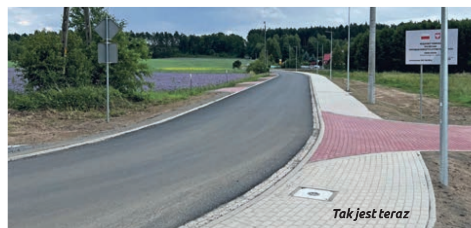
Tak jest teraz