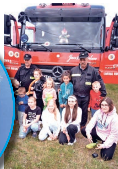
W Brodowicach świętowaliśmy Dzień Mamy i Dziecka. Razem ze strażakami!