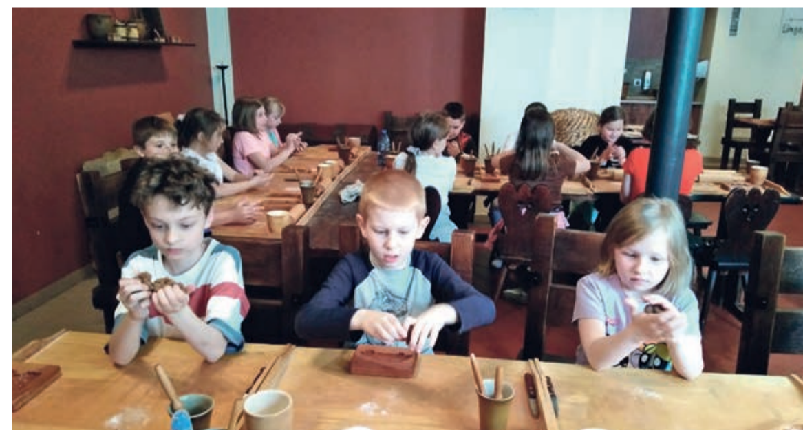
Trzecioklasiści z Chobieni wyruszyli na dwudniową wycieczkę trasą Gniezno-Biskupin-Malbork-Toruń. W końcu poznaliśmy miejsca, które do tej pory znane były tylko ze słyszenia.

Po przybyciu na miejsce zwiedzanie zaczęliśmy od Nowego Miasta. Po spacerze urokliwymi uliczkami do Muzeum Toruńskiego Piernika, gdzie poznaliśmy techniki wypieku tych ciastek, wysłuchaliśmy przepięknych legend związanych z miastem i słynąciami na cały świat piernikami. Następnie własnoręcznie ulepiliśmy pierniki w różnych kształtach – tak relacjonują wycieczkę uczniowie z Rudnej, którzy wybrali się do Torunia.