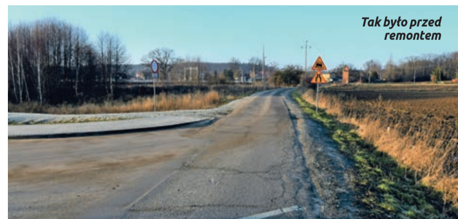
Tak było przed remontem

Wartość inwestycji wyniosła 946 347,14 zł, z czego 847 162,50 zł to dofinansowanie, jakie gmina pozyskała z Rządowego Funduszu Polski Ład: Program Inwestycji Strategicznych.