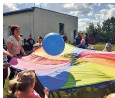
W Brodowie nie brakowało gier, zabaw i konkursów. Było super miło!