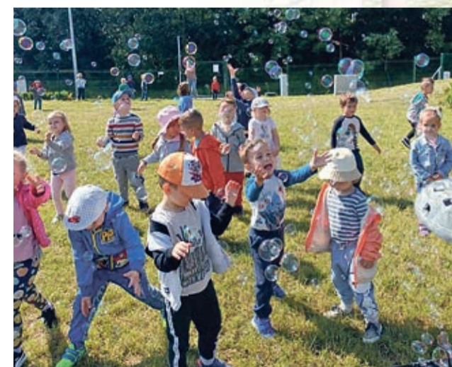
Dzień Dziecka w przedszkolu w Chobieni trwał cały tydzień. Na dzieci czekało mnóstwo atrakcji na świeżym powietrzu. Przedszkolaki odwiedziły interaktywne kino 3D, OK Park w Głogowie i bawili się wspólnie na terenach Przystani Kajakowej MARINA.