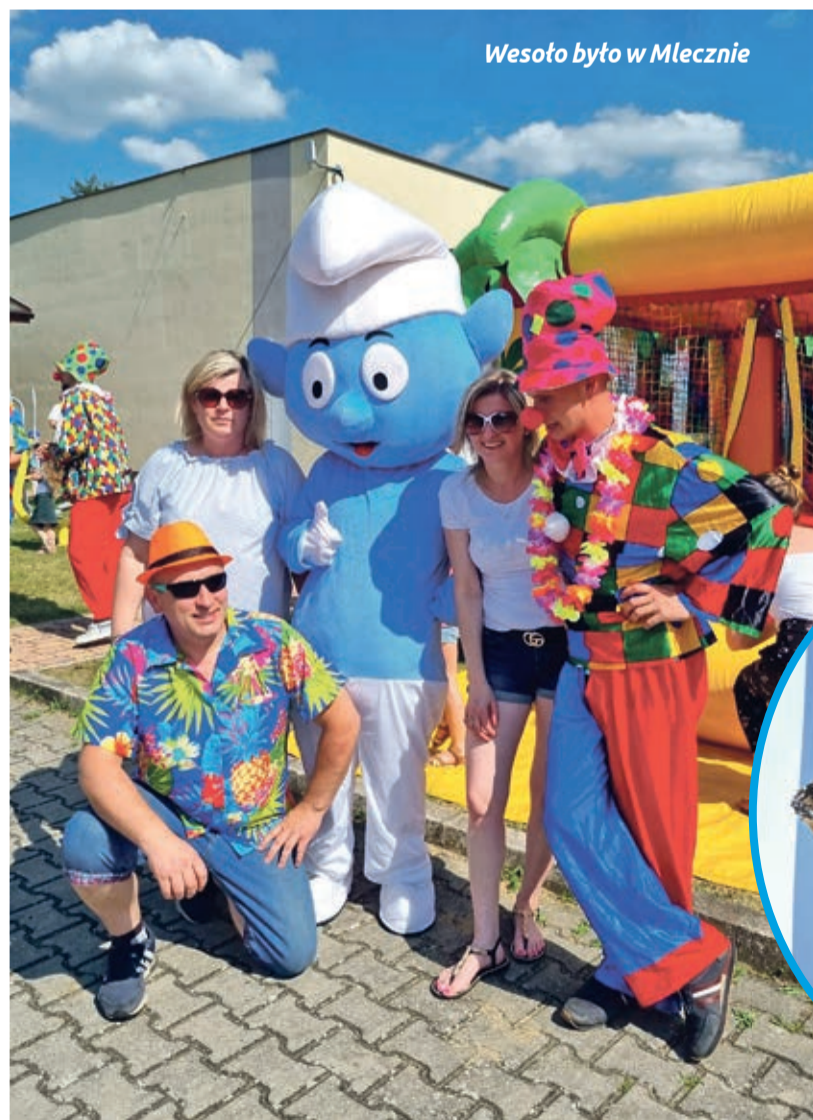
Wesoło było w Mlecznie