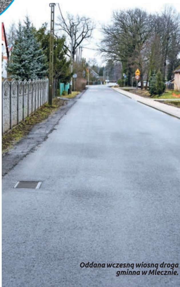
Oddana wczesną wiosną droga gminna w Mleczynie.