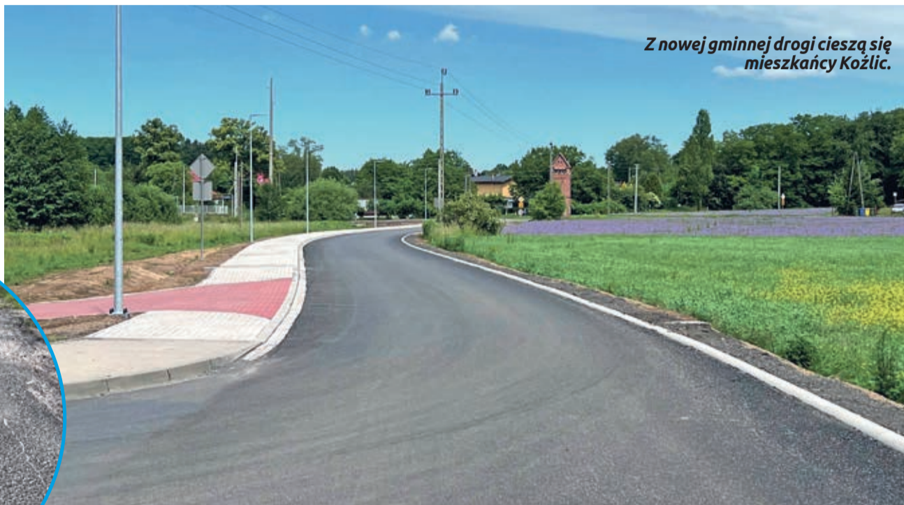
Z nowej gminnej drogi cieszą się mieszkańcy Koźlic.

Kolejne prace zaczną się na prawie 3,8 kilometrowym odcinku drogi powiatowej od Olszan przez Górzyn do Naroczyc, gdzie uzyskano dofinansowanie z Rządowego Funduszu Rozwoju Dróg w wysokości prawie 3 mln 887 tysięcy złotych. Gmina również wyłoży na tę inwestycję w tym roku 1 mln