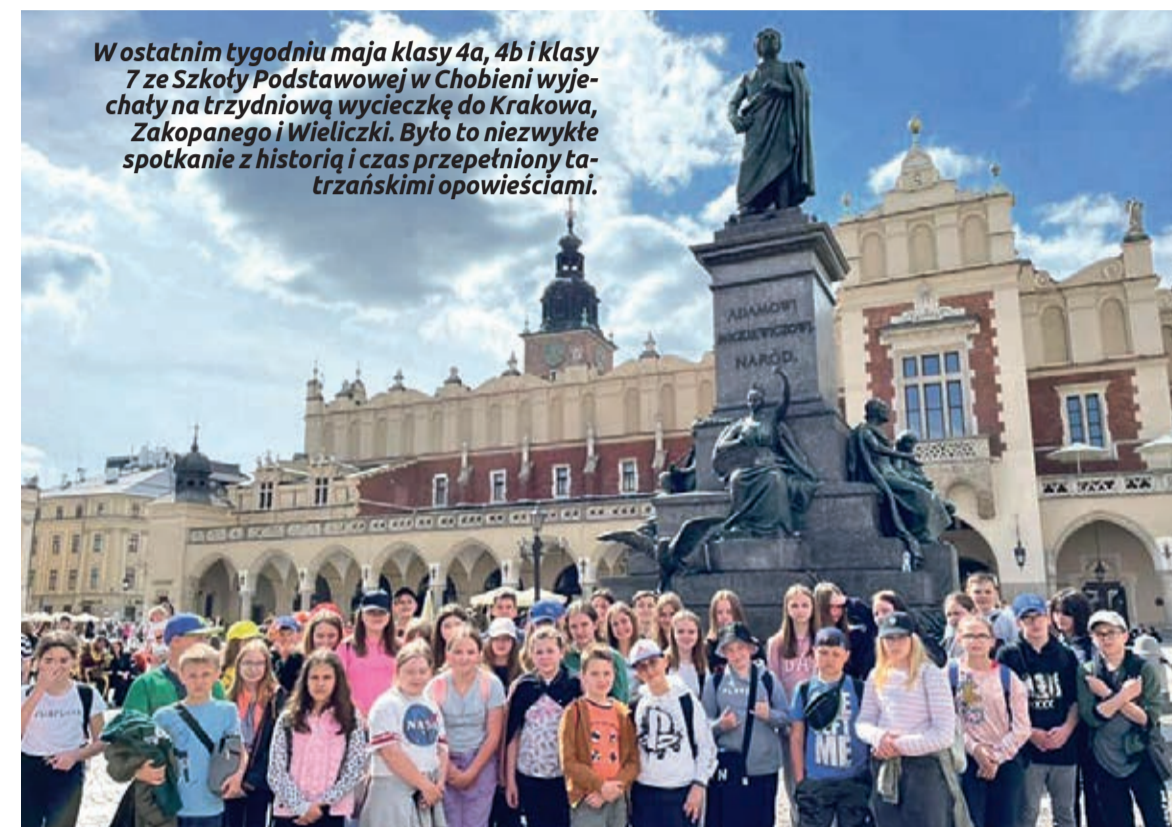
W ostatnim tygodniu maja klasy 4a, 4b i klasy 7 ze Szkoły Podstawowej w Chobieni wyjechały na trzydniową wycieczkę do Krakowa, Zakopanego i Wieliczki. Było to niezwykle spotkanie z historią i czas przepiękny ta-trzańskimi opowieściami.

Kopalnia soli w Wieliczce, Dom Mikołaja Kopernika, Twierdza Toruń, Katedra Wawelska czy Cmentarz Powstańców Warszawy. Te i inne atrakcje odwiedzi uczniowie szkół podstawowych w Rudnej i Chobieni. A to wszystko dzięki dofinansowaniu z Programu Ministerstwa Edukacji i Nauki „Poznaj Polskę”, które pozyskała nasza gmina.