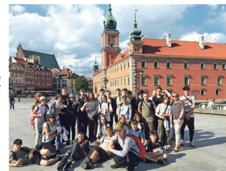
Uczniowie z Rudnej wybrali się w podróż do Warszawy. Odwiedzili m.in. Centrum Nauki Kopernik, Syrenę Warszawską, Cmentarz Powstańców Warszawy, Cmentarz Wojskowy na Powązkach, Grób Nieznanego Żołnierza czy Park Łazienkowski.

Niektórzy byli zdziwieni faktem, że ludzie mieszkali w chatkach razem ze zwierzętami czy sypiali na przy-