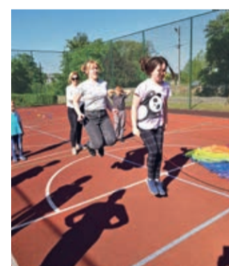
W Wądrożu świętowaliśmy na sportowo!