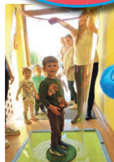
Basen kulkowy, bańki, balony, gry, tunele, tańce, tatuaże i wiele, wiele innych atrakcji, zorganizowanych przy współpracy Centrum Kultury Gminy Rudna. Tak świętowaliśmy podopieczni żłobka w Rudnej!