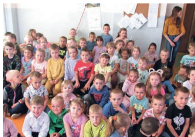
Z okazji Dnia Dziecka przedszkolaki z Rudnej obejrzały teatryk kukiełkowy: „Rudowtosa Katarzyna i jej supermoce”, przybliżający historię naszej gminy.