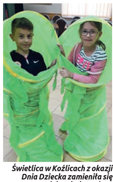
Świetlica w Koźlicach z okazji Dnia Dziecka zamieniła się w prawdziwy świat zabaw i najróżniejszych konkurencji, którym towarzyszyła duża dawka śmiechu.