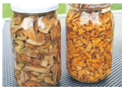
Rydzę i kurki w stonej zalewie smakują zimą, jak te świeżo zebrane.

ki ubite na gładką masę z masłem oraz przyprawą do ziemniaków, następnie rozsmarowane na zwykłych pszennych wafłach, pocięte na kawałki, obtoczone w jajku i bułce, i na koniec usmażone. Też bardzo prosty dodatek.