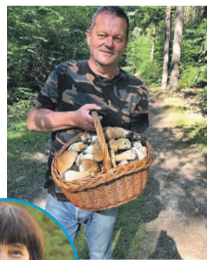
Borowiki zebrane na barszcz grzybowy.