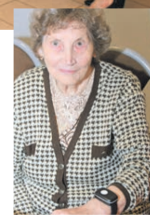
z Gminnym Ośrodkiem Pomocy Społecznej.