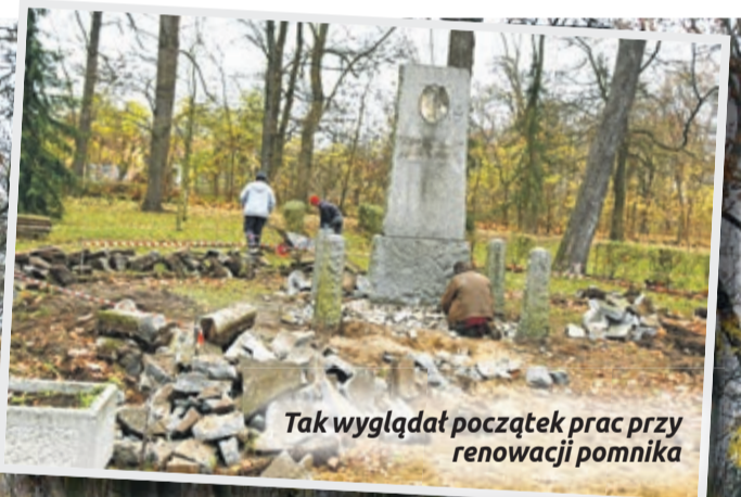
Tak wyglądał początek prac przy renowacji pomnika