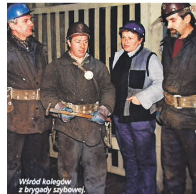
Wśród kolegów z brygady szybowej.

- Ja to się wyrobiłam na kopalni, jak dzisiaj dziewczyny na siłowni. Pomiedzy zjazdami ludzi łądowałam do klatki różne materiały, maszyny,