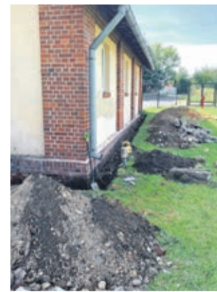
Tak wyglądała remiza przed remontem