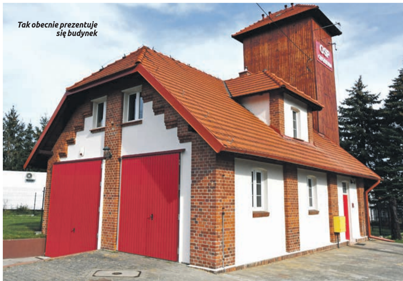
Tak obecnie prezentuje się budynek