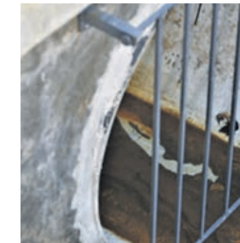
Tak obecnie wygląda odtworzony rów melioracyjny

Podczas prac oczyszczono teren z chwastów, a na odcinku 70 metrów położono tak zwany rurarz rowu melioracyjnego. W ramach inwestycji wykonano także studnię i ściankę czołową na istniejącym rowie.