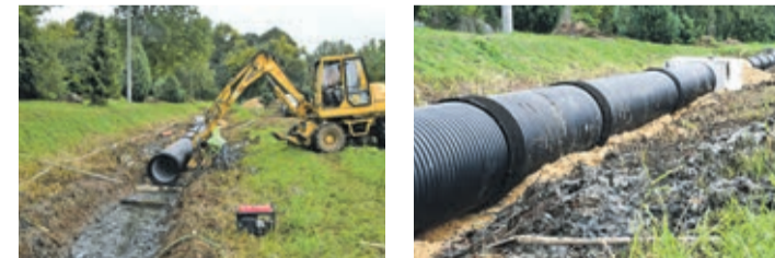
Tak wyglądała inwestycja w trakcie prac