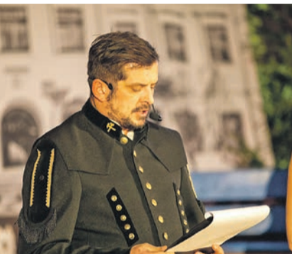
Można było zobaczyć Hadziuka, Michałową, Solejukową i Wioletkę. Nie zabrakło słynnego „arota”, ale w rudnowskim tui