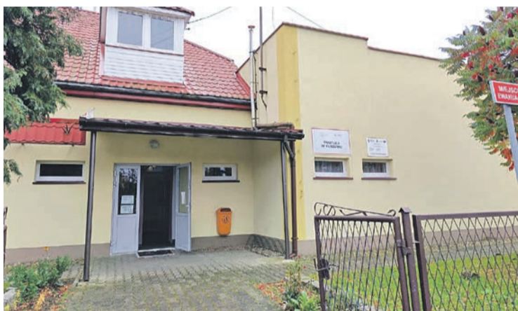
Modernizacja świetlicy w Kliszowie obejmie kompleksowy remont pomieszczeń w budynku głównym.

Obydwa projekt mają powstać w ciągu trzech miesięcy. Potem ogłoszone zostaną przetargi na wyłonienie wykonawców.