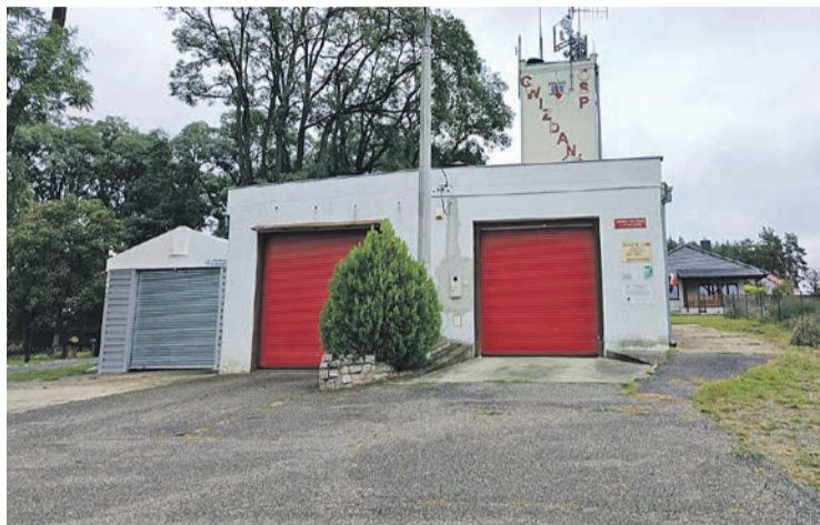
Istniejący budynek w Gwizdanowie zostanie rozebrany.

W budynku znajdą się także sanitariaty, szatnia, zaplecze kuchenne i magazyn na wyposażenie przeciwpowodziowe z możliwością wejścia do niego od zewnątrz.